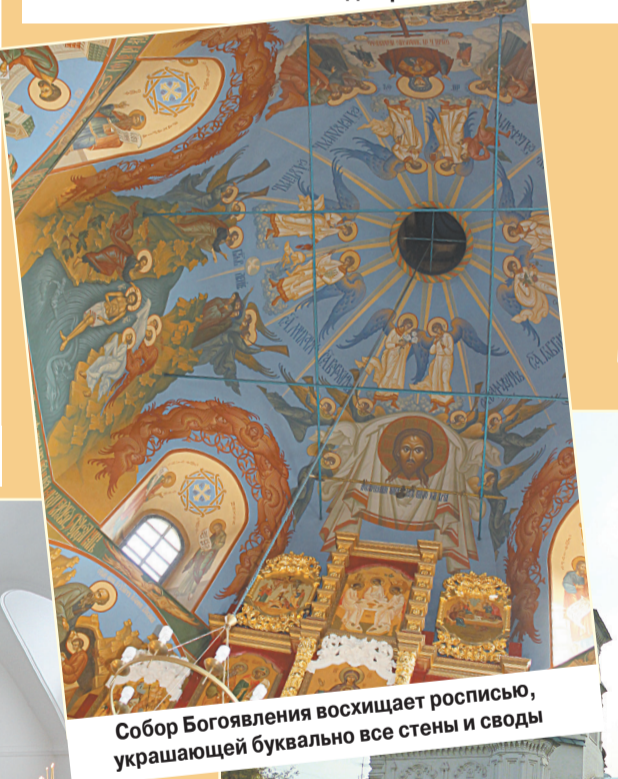
Собор Богоявления восхищает росписью, украшающей буквально все стены и своды