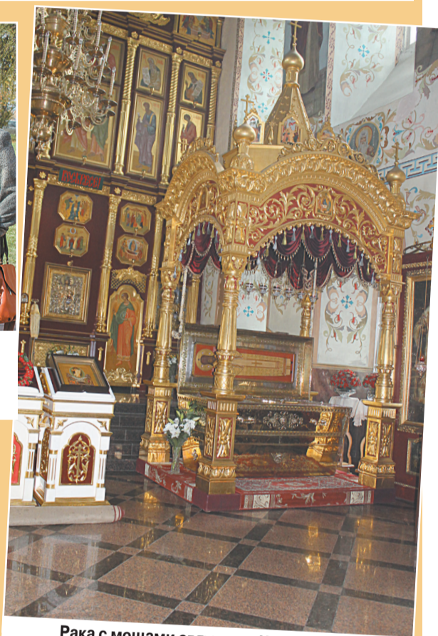
Рака с мощами святителя Иннокентия Иркутского в Знаменской церкви