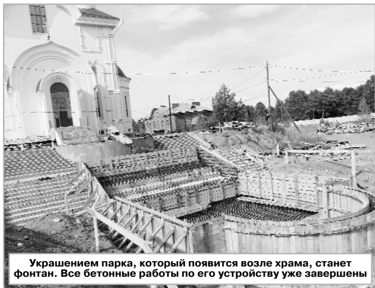
Украшением парка, который появится возле храма, станет фонтан. Все бетонные работы по его устройству уже завершены