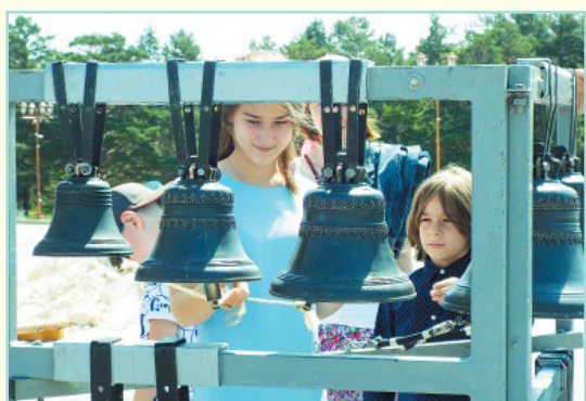
Попробовать сыграть на передвижной звоннице могли все желающие

Ксения ПЕТРОВА