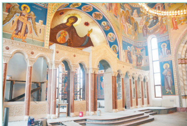
Для мраморного иконостаса уже написана часть икон