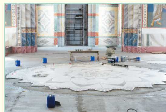
Укладка пола со сложными декоративными элементами — процесс трудоёмкий