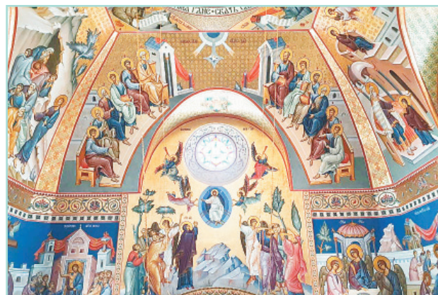
В четверике, основном помещении храма, росписью покрыта поверхность площадью более 2000 квадратных метров