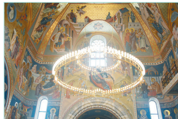
Большой двухъярусный светильник — хорос — располагается прямо под главным куполом храма