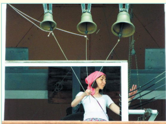
Своё мастерство шелеховцам продемонстрировали звонари из Иркутска, Красноярска, Санкт-Петербурга