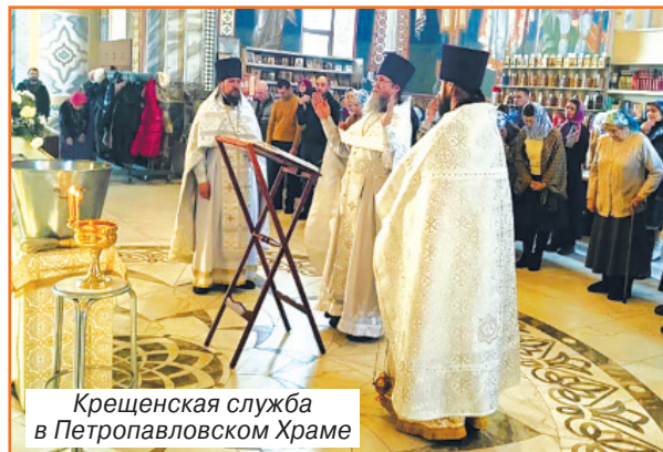
Крещенская служба в Петропавловском Храме

Читайте нас на сайте: www.shel-vestnik.ru , а также в социальных сетях vk.com/shelvestnik ok.ru/shelvestnik