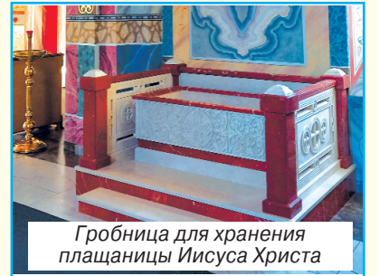
Гробница для хранения плащаницы Иисуса Христа

В храме апостолов Петра и Павла много святынь, в том числе частицы мощей разных святых, Животворящего Креста Господня. Такого количества почитаемых реликвий нет ни в одном другом храме Иркутской области, поэтому шелеховский храм можно считать уникальным.